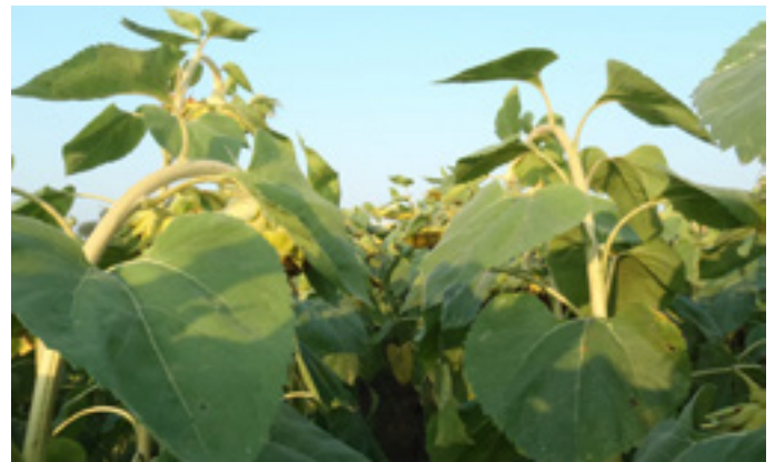
Alternária – Propulse 1.0 l – BBCH16, BBCH55 (Európai fejlesztési vizsgálat, 2011.)

Részletesebb információért keresse bizalommal területi képviselőjét!