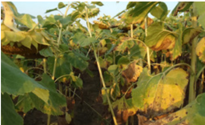
Alternária – kezeletlen állomány (Európai fejlesztési vizsgálat, 2011.)