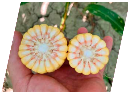
/// DKC3972 (bal), Versenytárs (jobb), Mosonmagyaróvár, 2024