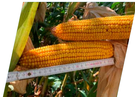
/// DKC3972, Máriapócs, 2023