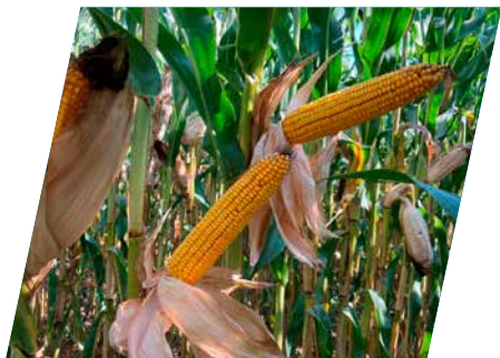
/// DKC3972, Máriapócs, 2023

...akik átlagos vagy gyengébb termőhelyekre keresnek stabilan jól termő hibridet az igen korai érécsoportban.