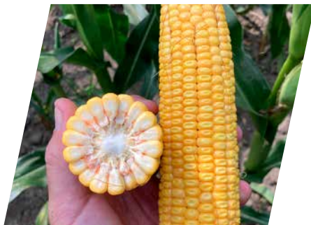
/// DKC4125, Vashosszúfalu, 2023