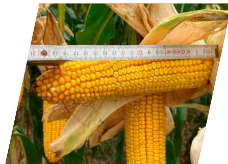
/// DKC4125, Máriapócs, 2023