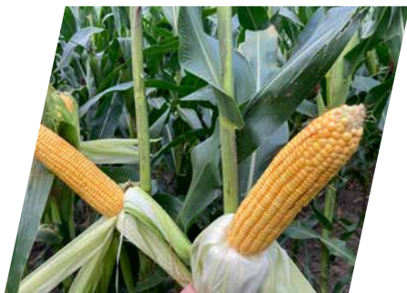
/// DKC4125, Vashosszúfalu, 2023

...akik új nemesítésű, korai érésű kukoricát keresnek kiváló aszály- és stressztűrő képességgel párosulva, illetve fontos számukra a kiváló egészségprofil és a magas hektolitertömeg.