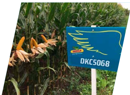
/// DKC5068, Kaba, 2020