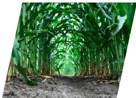
/// DKC5068, Hódmezővásárhely, 2020

...akiknél az évjáráthatás jelentősen befolyásolja a termést. Kiváló termésstabilitása miatt kitettebb helyeken is sikeresen termesztethető. 2018-ban az Év Kukoricájának választotta a Magyar Kukorica Klub.