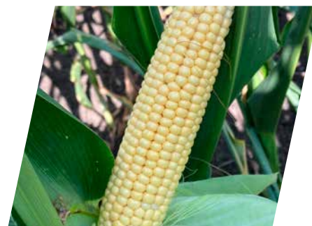
/// DKC5068, Püspökladány, 2021