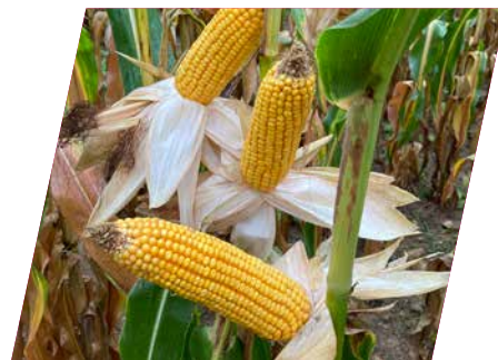
/// DKC5182WX, Oxyane, Meximieux, Franciaország, 2021