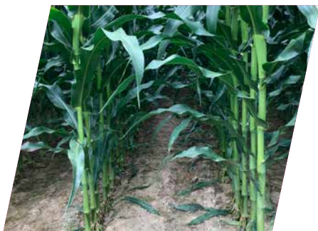
/// DKC5182WX, Boumourt, Franciaország, 2021

...akik középérésű, magas terméshozamú waxy hibridet keresnek, intenzív termesztési körülmények mellé.