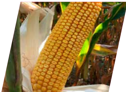
/// DKC5182WX, Boumourt, Franciaország, 2021